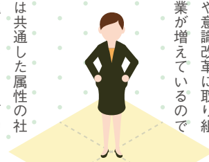
●図3 女性社員の活用と経営業績の関係例

現状の2.5倍となる1,000人を目指すという目標を設定しました。その他にも、「女性活用」における明確な目標を掲げ、社内の環境整備や意識改革に取り組むことで本腰を入れ始めている企業が増えています。(※図2)