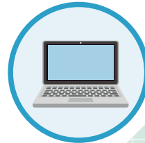
8 システムエンジニア

理系として培ってきた専門知識を活かして「研究開発職」に就きたいと考える理系学生は多いだろう。研究開発職がメーカーの経営戦略において重要なポジションであることは疑いない。しかし、研究開発職以外にも理系の専門性や素養を活かすことができる仕事は数多くある。企業としても、そういったポジションにおいて理系人材を強く求めており、活躍のフィールドは少なくないのだ。このページでは「理系が活躍できるメーカー関連の仕事」を紹介する。「どんな仕事が自分にマッチするか」視野を広く持つものづくりへの関わり方を考えてみてはどうだろうか。