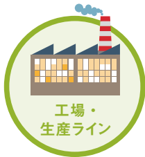
工場・ 生産ライン