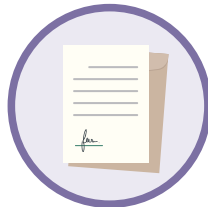
7 知的財産 (パテントエンジニア)