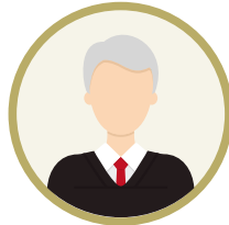
お客様 (顧客企業 / 一般ユーザー)