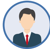
6 技術系営業 (セールスエンジニア)